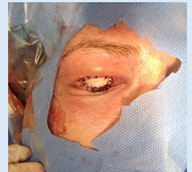
Χειρουργείο επανένθεσης του βαριδίου χρυσού στη δεύτερη ασθενή & πλήρωση του ελλείμματος με τη χρήση δερματικού κρημού