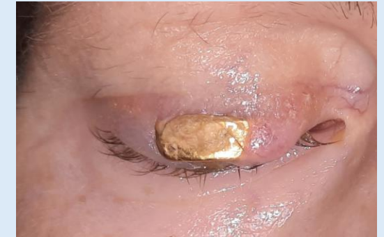
Έκθεση του βαριδίου χρυσού από το δέρμα του άνω βλεφάρου της ασθενούς