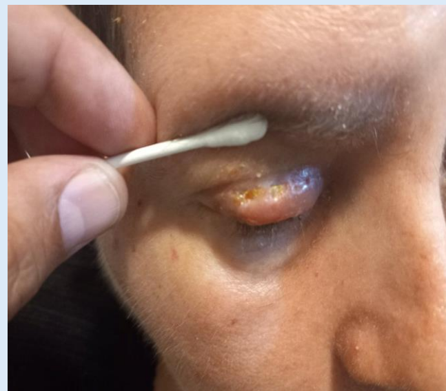
Υποτροπή της έκθεσης του βαριδίου μετά την επανεπέμβαση

Η λειτουργική και αισθητική αποκατάσταση ήταν ίδια με την πρώτη επέμβαση. Ένα εξάμηνο μετά την δεύτερη επέμβαση η δεύτερη ασθενής επανήλθε πάλι λόγω έκθεσης του βαριδίου, οπότε έγινε αφαίρεση χωρίς περαιτέρω αποκατάσταση. Η πρώτη ασθενής παρέμεινε ασυμπτωματική.